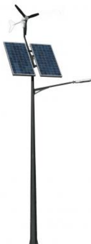
Oświetlenie: zestaw cena 8000 zł brutto