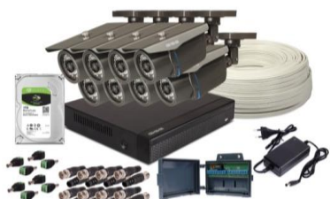
Monitoring: zestaw cena 3500 zł brutto