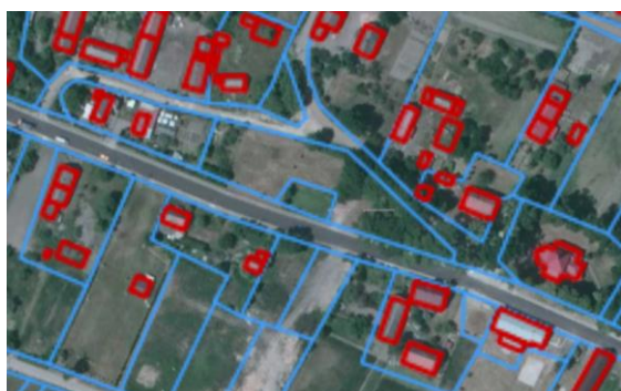
Lokalizacja inwestycji w centrum wsi Miłocice.